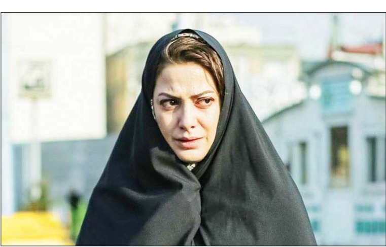
علیرضا زرین‌دست در صحنه فیلم «مهرجانه»

توسط مصیب لب به اعتراف باز نکرده کمتر کسی می‌تواند ادعا کند که خیانت مصیب به ولی‌نعمتش (هاشم) و طراحی بی‌آبروکردن او و تبعات بعدی‌اش از سوی او را پیش‌بینی می‌کرده است. اگرچه غافلگیری بزرگ‌تر و درواقع اصلی و اساسی اثر بازهم فراتر از این است و در دست هنگامی که پایه‌پای حجت از نامردی مصیب (حتی اگر در حق یک لات آسمان جلی مانند هاشم باشد) ناراحت و در انتظار گیرافتادن و تقاص پس‌دانش هستیم، فیلم‌ساز تلنگر واپسین خود را محکم‌تر از ضربه‌های قبلی وارد می‌کند؛ وقتی که معلوم می‌شود مصیب با طراحی توطئه ضبط فیلم در استخر زنانه درواقع جواب ناجوانمردی هاشم و تعرض ناموسی‌ای که به دستور او انجام شده را داده و آنجا که یقین حاصل می‌کنیم ادعای مصیب مبنی‌بر آلت‌دست قراردادن حجت و تبدیل او به یک حمل‌کننده مواد مخدر درست و بی‌نقص است، انکار که صورت‌مسئله برامیان تا حدودی عوض می‌شود، درست در چشم برهم‌زدنی نفرت اولیه‌مان از مصیب که با توطئه‌اش باعث مرگ یک بز جوان بی‌گناه و رفتن شوهر متعصبش زیر تیغ اعدام شده، به نفرت توأمان و بسیار بزرگ‌تر از هاشم