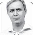
علی اصغر سیدآبادی

از نخستین روزهای شکل‌گیری صهیونیسم در سرزمین فلسطین، پیش از آنکه هنوز نامی روی کشورشان بگذارند، هنوز وقتی که سرزمین‌های فلسطین تحت قیمومیت انگلیسی‌ها بود، رابطه میان ایران و آنان پرچالش بود. هنگام تشکیل دولت یهود تعدادی مسلمان ایرانی در آنجا زندگی می‌کردند که از خانه و کاشانه خود رانده شده بودند. دولت «ساعد» به بهانه رقت و فتق امور آنان، دفتری دایر کرد. پیش از او «محمدعلی فروغی» توصیه کرده بود که در این قضیه هم باید هوای جهان اسلام را داشت و هم نباید آن‌قدر در این هواداری پیش رفت که ایران را درگیر جنگ کند. در کابینه احمد قوام هم تقریباً همین سیاست دنبال شد. بعدها در دوره مصدق همان نمایندگی هم تعطیل شد، اما از دهه ۴۰ با حفظ همین سیاست، رابطه دولت یهود و ایران فعال‌تر شد.