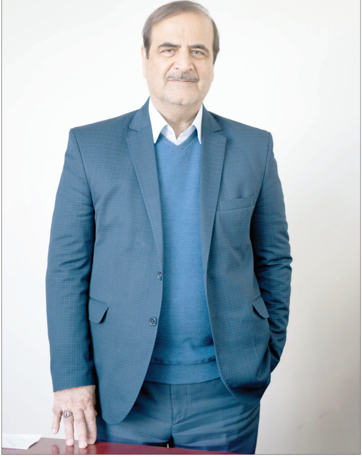
این گفت‌وگورا در صفحه ۲ بخوانید.