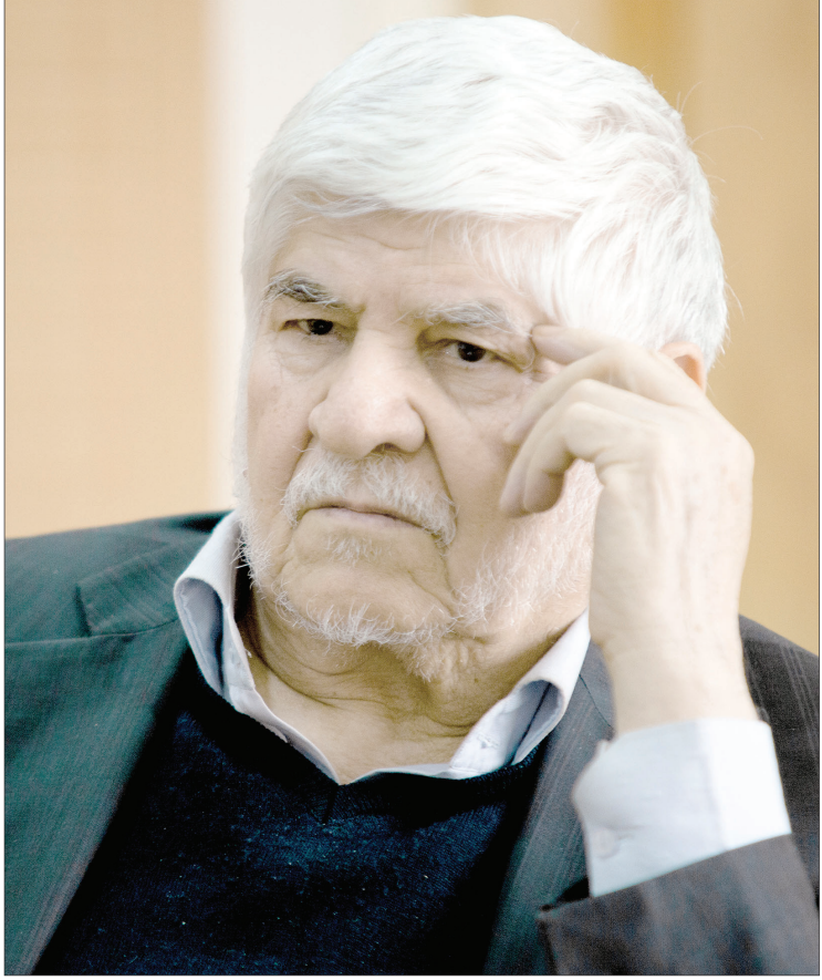
این گفت‌وگو را در صفحه ۲ بخوانید.