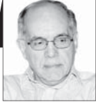
کوروش احمدی دبلمات پیشین

تعلیق رابرت مالی، فرستاده ویژه آمریکا برای ایران را می‌توان تحولی در روند مذاکرات ۲۸ماهه ایران و آمریکا به‌شمار آورد. او در دو، سه ماه گذشته نقشی در تماس‌های غیرمستقیم بین ایران و آمریکا نداشته و نه‌تنها قطع دسترسی او به اسناد طبقه‌بندی‌شده که دلیل اعلام‌شده آن سهل‌انگاری در کار با این اسناد بوده، ادامه دارد؛ بلکه تبدیل مرخصی با حقوق او به مرخصی بدون حقوق در هفته گذشته می‌تواند حاکی از سیر تحقیقات به ضرر او باشد. رابرت مالی یک مقام معمولی در دولت آمریکا نیست. او که به‌سرعت و تنها حدود یک هفته بعد از شروع به کار بایدن به‌عنوان نماینده ویژه برای ایران تعیین شد، در مدت بیست و چند سال گذشته همیشه دارای سابقه و موقعیت مناقشه‌آمیزی در واشنگتن بوده است. تصور ناظران هنگام انتصاب او این بود که قصد بایدن از این انتصاب نشان‌دادن تمایلش به تسریع و تسهیل کار احیای برجام بوده است. فرض بر این بود که مالی با توجه به گرایش‌های سیاسی‌اش می‌توانست در این زمینه مؤثر عمل کند.