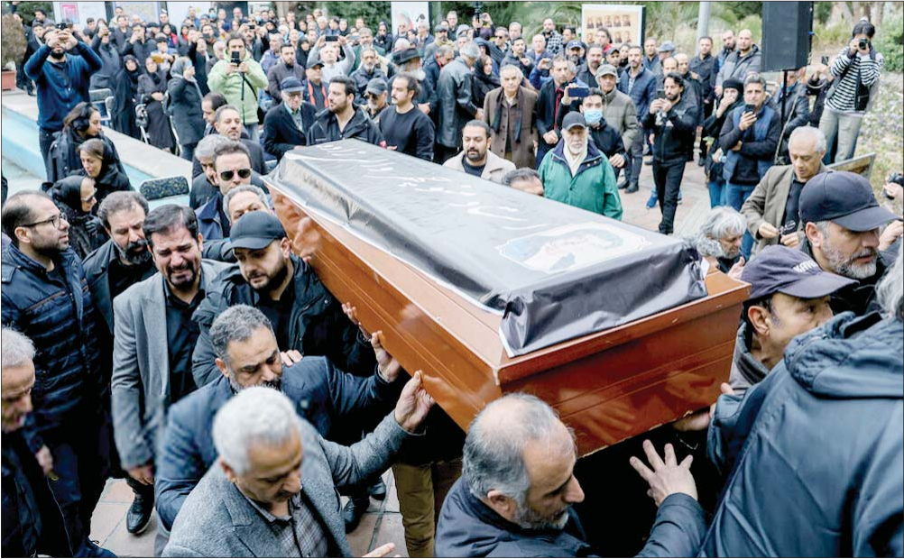
تشییع پیکر زنده‌یاد «منوچهر والی‌زاده» دپلور و کوبنده پیشکسوت رادیو و تلویزیون، صبح جمعه با حضور شخصیت‌های فرهنگی، هنری، جمعی از هنرمندان دوبله، سینما، تلویزیون و اقدار مختلف مردم در مقابل خانه هنرمندان برگزار شد.

فهم خوب هر بازی با رقابت زمانی رخ می‌دهد که ما بتوانیم از بالا به صفحه بازی نگاه کنیم، در دنیای رقابتی این «نگاه از بالا» یعنی «نگاه از آینده»، یعنی بتوانیم از آینده‌ای که منتظر رخ‌دانش هستیم، بایستیم و خود را و جهان را و شرکت‌های فعال را نگاه کنیم. اما مشکل زمانی است که ما آینده را نمی‌توانیم دقیق بشناسیم و آن را دقیق تحلیل کنیم، چون آینده‌های مختلفی ممکن است رخ دهد. به همین دلیل است که سناریونگاری اهمیت می‌یابد. یعنی به جای دل‌بستن به یک آینده، بتوانیم در آینده‌های مختلف