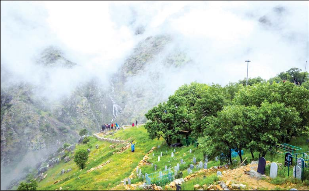
روستای اورامان تخت که در منطقه اورامانات واقع شده،یکی از زیباترین مناطق کوهستانی ایران و اماکن دیدنی استان کردستان است. رودخانه‌های سیروان و لیله از میان این دهکده می‌گذرند. اورامان یکی از مناطق گردشگری زیبای ایران است که هرساله گردشگران داخلی و خارجی بسیاری از آن بازدید می‌کنند.

اما وقتی بخشی از جهان که قدرتمند نیز هست این‌گونه نمی‌اندیشد، چه کاری از دست ما بر آمده و چگونه می‌توانیم جامعه خود را تغییر دهیم؟ شاید جواب در دهکده کوچک جهانی باشد. جهان به سرعت تغییر یافته است. حضور فضای مجازی، اینترنت و تمام اشکال جدید ارتباطات سبب درهم‌تنیدگی انسان‌ها و جوامع شده و عملاً روند توزیع اطلاعات قابل مقایسه با سالیان گذشته نیست. اطلاعات نقشی فزاین از دولت‌ها و قدرت‌ها بازی می‌کنند و به عنوان یک بازیگر بسیار مهم در عرصه جهانی مطرح هستند. برای همین است که قدرت‌های بداخلاقی که ذکر کردیم همواره به دنبال محدودکردن اطلاعات و روند آن از جمله محدودیت برای اینترنت و فضای مجازی هستند؛ زیرا به قدرت برهم‌زننده آن بی برده‌اند. و آنچه در اینجا می‌خواهم ذکر کنم ترکیب دنیای واقعی و دنیای مجازی برای بهبود شرایط و حفظ و اشاعه ارزش‌های انسانی است. اما چگونه ارتباطات مدرن و بر پایه تکنولوژی می‌توانند به ترویج مفاهیم انسانی یاری رسانند؟ برای این کار باید این مفاهیم در دنیای واقعی نیز رشد یابند. یعنی ما باید پاسدار این ارزش‌ها در دنیای واقعی بوده