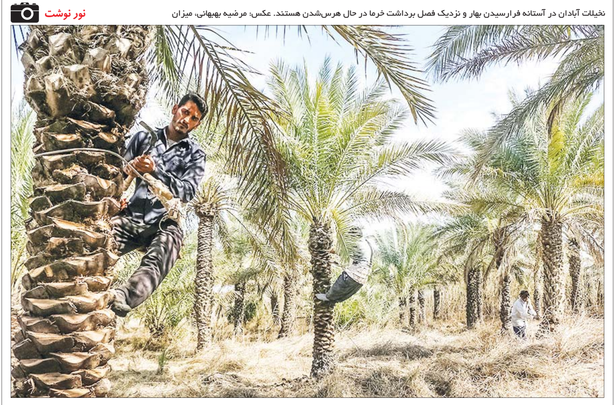
نخيلات آبادان در آستانه فرارسیدن بهار و نزدیک فصل برداشت خرما در حال هرس شدن هستند.