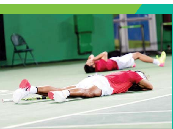
قهرمانی ندال و لوپز در تنیس دوپل