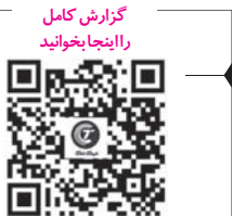
گزارش کامل رایانچایخواتید