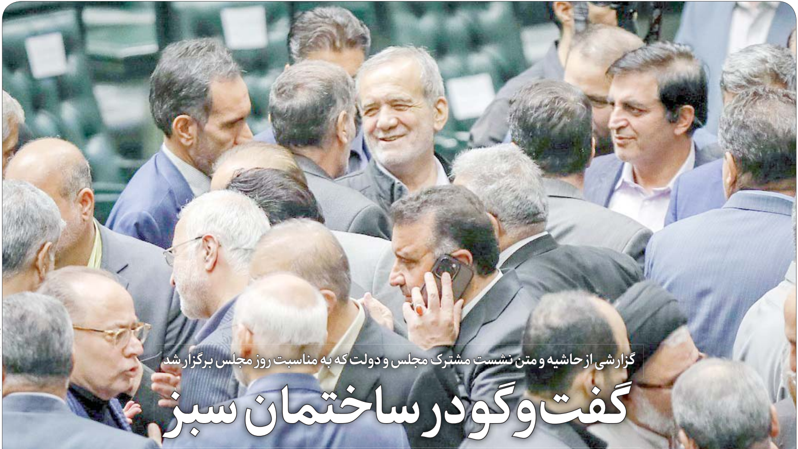
گزارش تیریک را در صفحه ۲ بخوانید

گزارشی از حاشیه و متن نشست مشترک مجلس و دولت که به مناسبت روز مجلس برگزار شد