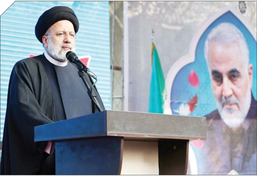
سیدابراهیم رئیسی در مراسم تشییع شهدای گمنام

رئییی در آیین بدرقه شهدای گمنام؛ از کانال‌های مختلف پیام می‌دهند که آماده گفت‌وگو هستیم و قصد براندازی نداشتیم