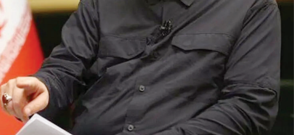
گزارش رادر صفحه ۲ بخوانید