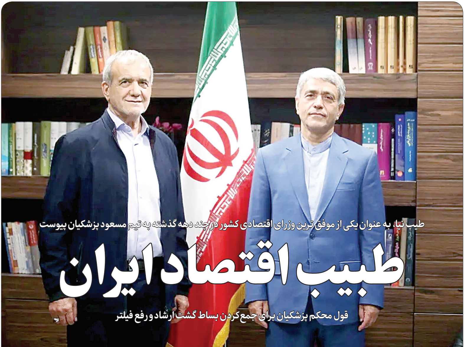
طیب نیا، به عنوان یکی از موفق‌ترین وزرای اقتصادی کشور در چند دهه گذشته به تیم مسعود پزشکیان پیوست