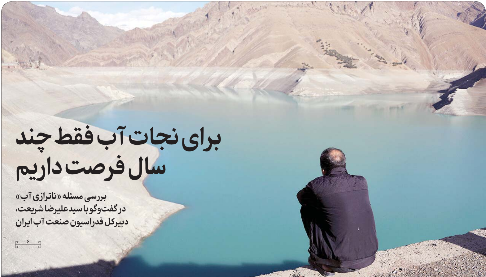
کزارش تیشریک‌را در صفحه ۲ بخوانید