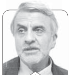
سیدمصطفی هاشمی طبا