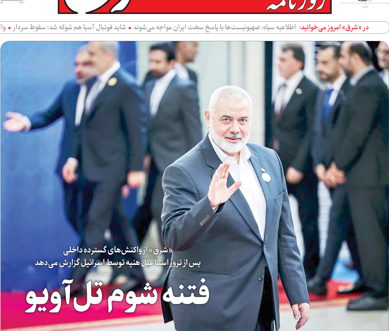
این گزارش رادر صفحهٔ انجمن‌نگار عکس، جدیدنگلی فارس