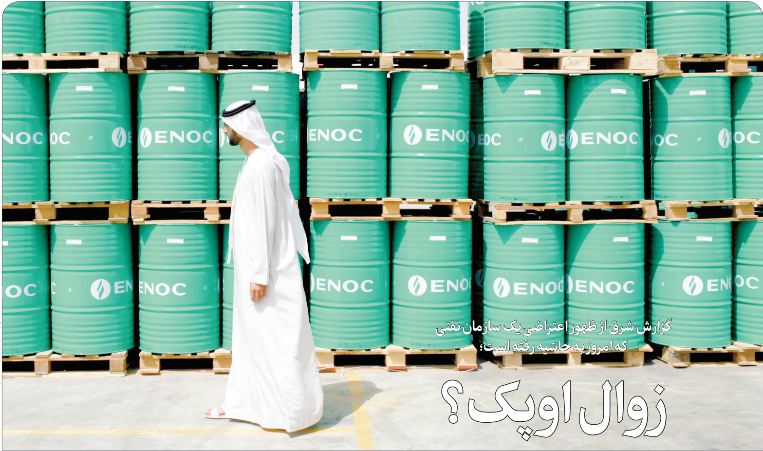
در صفحه ۷ بخوانید

گزارش شرق از ظهور اعتراضی یک سازمان نفتی که امروز به حاشیه رفته است؛