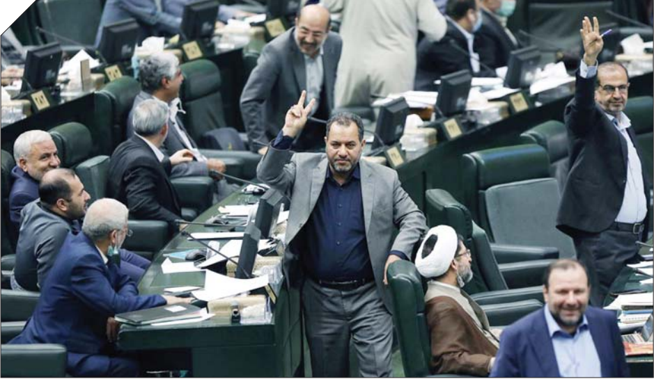
نمایندگان مجلس شورای اسلامی در جلسه علنی، ۲۰ فروردین ۱۴۰۲

پنجشنبه و جمعه‌هاست». این عضو کمیسیون امور داخلی کشور و شوراها در مجلس تصریح کرد: رفع تبعیض از همه نیروهای شاغل در تعطیلات همگانی، گامی مهم و ضروری است که باید شامل حال همه کارکنان اعم از دولتی و بخش خصوصی شود. توجه به طیف کمتر از ۲۰ درصدی کارمندان دولت نه‌تنها منجر به توسعه گردشگری مدنظر دولت نمی‌شود، بلکه هدف بهره‌وری مستتر در دل لایحه را نیز طبقاتی خواهد کرد. اگر فقط برای به‌دست‌آوردن یک هدف فرعی کلیت اقتصاد آسیب ببیند، کوبی انگار خواستیم ابورا در دست کنیم اما چشم را هم کور کردیم.