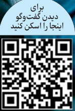
برای دیدن گفت‌وگو اینجا را اسکن کنید