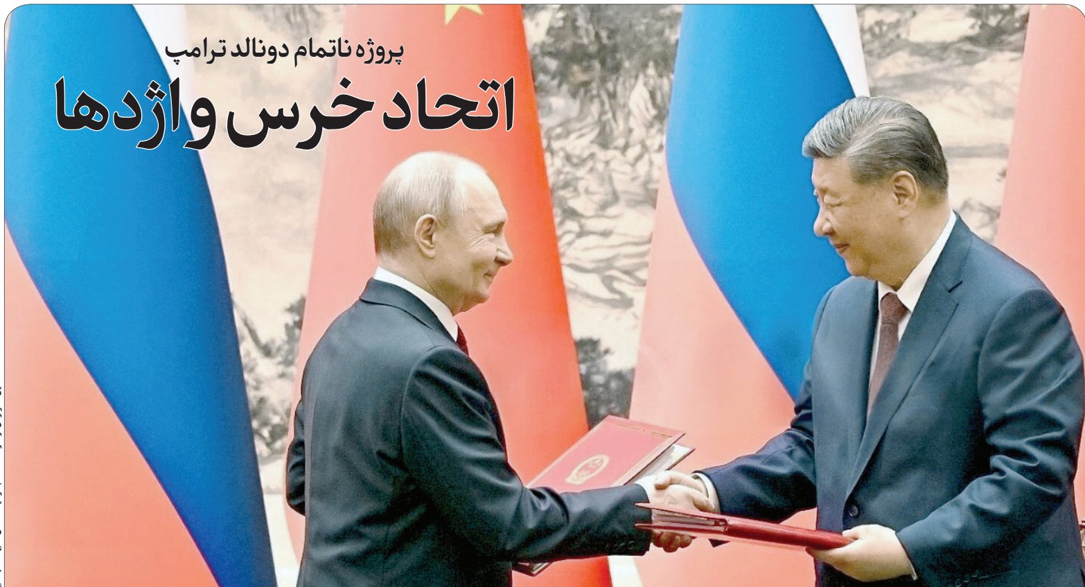
این گزارش را در صفحه ۴ بخوانید