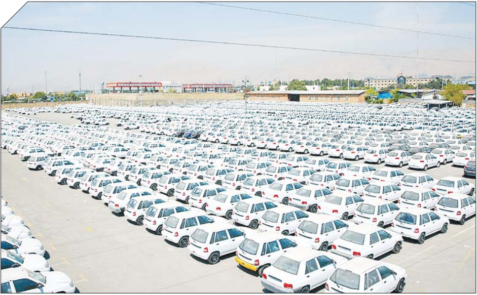
● نمایندگان مجلس شورای اسلامی در بازدید از پارکینگ خودروهای دولتی

این نماینده منتقد سیاست‌های وزارت صمت ادامه داد: «یکی