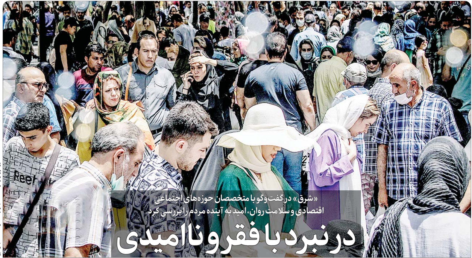
این گزارش را در صفحه ۱۰ بخوانید.

رئیس جمهور: رهبر انقلاب با سرمایه‌گذار آمریکایی در کشور هیچ‌گونه مخالفتی ندارند