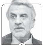
سیدمصطفی هاشمی طبا

در پی اعلام شعار سال یعنی «سرمایه‌گذاری برای تولید»، معاون اول محترم ریاست جمهوری اعلام کرد که یک گروه کاری در ریاست جمهوری برای تحقق این امر تشکیل شده است. می‌بینیم که همچنان که می‌گویند «تاریخ تکرار می‌شود»، تاریخ به نوعی تکرار شده است. پس از ابلاغیه مقام معظم رهبری درباره اقتصاد مقاومتی در سال ۹۲ بلافاصله مقامات لشکری و کشوری و تقنینی و قضائی از این ابلاغیه کمال استقبال را کردند و هرکس به فراخور خود پای در منبر وعظ و خطابه برای اجراکردن اقتصاد مقاومتی گذاشت و حتی دژبان‌های ارتش هم بر روی موتورهای خود تابلوی اقتصاد مقاومتی نصب کردند.