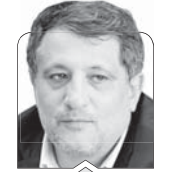
محسن هاشمی رفسنجانی

با آغاز سال ۱۴۰۴ و تکرار مطالبه‌مند رهبر انقلاب درخصوص «سرمایه‌گذاری برای تولید»، بار دیگر نگاه‌ما متوجه چگونگی ایفای نقش دولت در تحقق اهداف اقتصادی شد. در میان ابزارهای در اختیار حاکمیت برای نیل به این هدف، نحوه مدیریت و تخصیص بودجه عمرانی جایگاهی کلیدی دارد. بررسی لایحه بودجه ۱۴۰۴ نشان می‌دهد که با وجود افزایش عددی اعتبارات تملک دارایی‌های سرمایه‌ای، واقعیت‌های عملکردی آن حاکی از کاهش مداوم سهم طرح‌های عمرانی، افزایش عمر متوسط پروژه‌ها به بالای ۱۷ سال و تداوم تخصیص منابع به طرح‌هایی فاقد توجیه اقتصادی یا اولویت ملی است. این در حالی است که با وجود منابع محدود و تورم ساختاری، هرگونه خطای استراتژیک در تخصیص بودجه می‌تواند به تعمیق رکود، گسترش بی‌عدالتی منطقه‌ای و ناکارآمدی کلان اقتصادی منجر شود. از همین رو، بازمهندسی نظام بودجه‌ریزی عمرانی با محوریت «غریبالگری»، «شفافیت» و «بازده اجتماعی بالا»، ضرورتی فوری برای برون‌رفت از بحران پنهان سرمایه‌گذاری عمومی تلقی می‌شود.