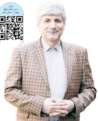
این گزارش را در صفحه ۱۰ بخوانید.

اجتناب از جنگ؛ سیاست مشترک تهران و واشنگتن