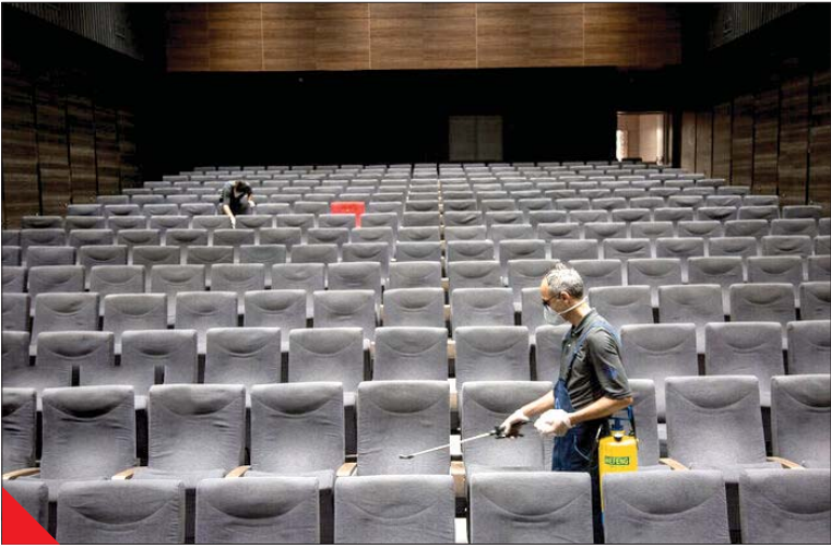
یک نفر در حال تمیز کردن سالن سینما

است، دراین‌باره گفت: دفتر ما از سال گذشته و امسال حدود ۱۰ فیلم را آماده اکران دارد، ولی مسئله اینجاست که صاحبان فیلم‌ها نگران هستند و نمی‌دانند شیوع کرونا وضعیت سینماها را به چه شکل پیش می‌برد. ابتدا باید باخورد این چند فیلمی که تازه اکران شدند، مشخص شود تا بعد تصمیم بگیریم چون به‌رحال هر فیلمی که ساخته می‌شود، ترجیح این است که در همان سال اکران شود ولی این نگرانی وجود دارد که دولت با شرایط فعلی جقدر می‌تواند اکران فیلم‌ها را تضمین کند؟ او که فیلم‌های «دینامیت»، «دوزیست»، «خط استوا» و «سه کام جیس» را از سال گذشته در نوبت اکران دارد، درباره انتخاب فیلم‌های اکران نوروزی ادامه می‌دهد: اگر بتوانیم جریان سینما را در عید با فیلم‌های جشنواره دوباره راه بیندازیم، اتفاق خیلی بهتری می‌افتد، چون اگرچه فیلم‌های خوب دیگری هم در نوبت اکران هستند، ولی به لحاظ جریان رسانه‌ای نمایش فیلم‌های جشنواره در جذب مخاطب تأثیر بیشتری دارد. به نظر برای شروع باید دو، سه فیلم خوب جشنواره در عید نوروز اکران شوند.