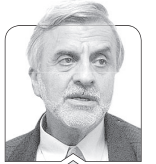
سیدمصطفی هاشمی طباطبائی

پنجشنبه ۱۷ اردیبهشت ۱۴۰۵ ۱۹ ذی القعدة ۱۴۴۷ ۷ می ۲۰۲۶ سال بیست و دوم شماره ۵۳۷۹ ۴۰ هزار تومان ۸ صفحه