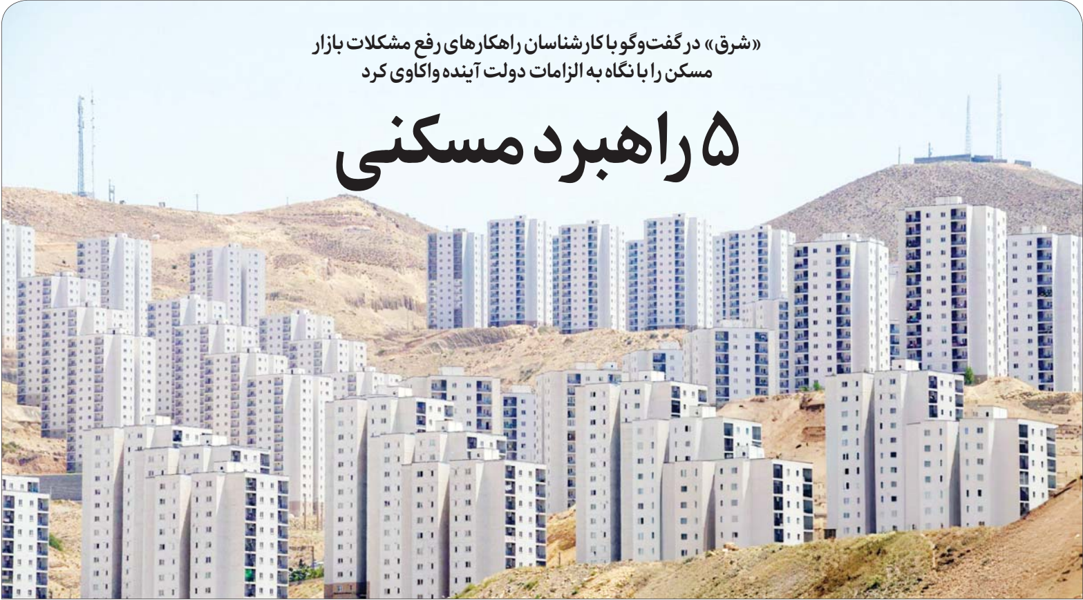
این گزارش را در صفحهٔ ۴ خوانید.