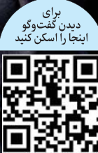
برای دیدن گفت‌وگو اینجا را اسکن کنید

این گفت‌وگو در صفحه ۱۱ بخوانید.