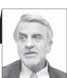
سیدمصطفی هاشمی طبا

ریاست محترم سازمان محیط زیست درباره نگاه برنامه هفتم توسعه به محیط زیست فرموده‌اند که در لایحه مذکور، به محیط زیست توجه لازم نشده و امیدواریم در مجلس این نگاه بهتر شود و موارد دیگری درخصوص محیط زیست ایران در لایحه گنجانده شود.