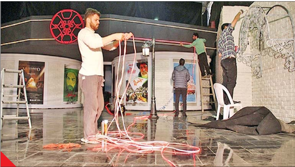
فریدون جبرانی در حال بستن دکور برنامه هفت

تمام اینها «هفت» با اجرای جبرانی بعد از سه سال از آغاز پخش متوقف و اعلام شد شخص دیگری اجرای برنامه را ادامه خواهد داد.