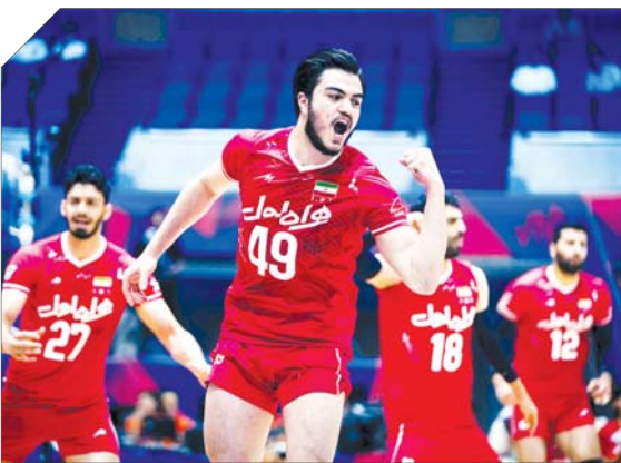
• کسب تیم ملی فوتبال ایران