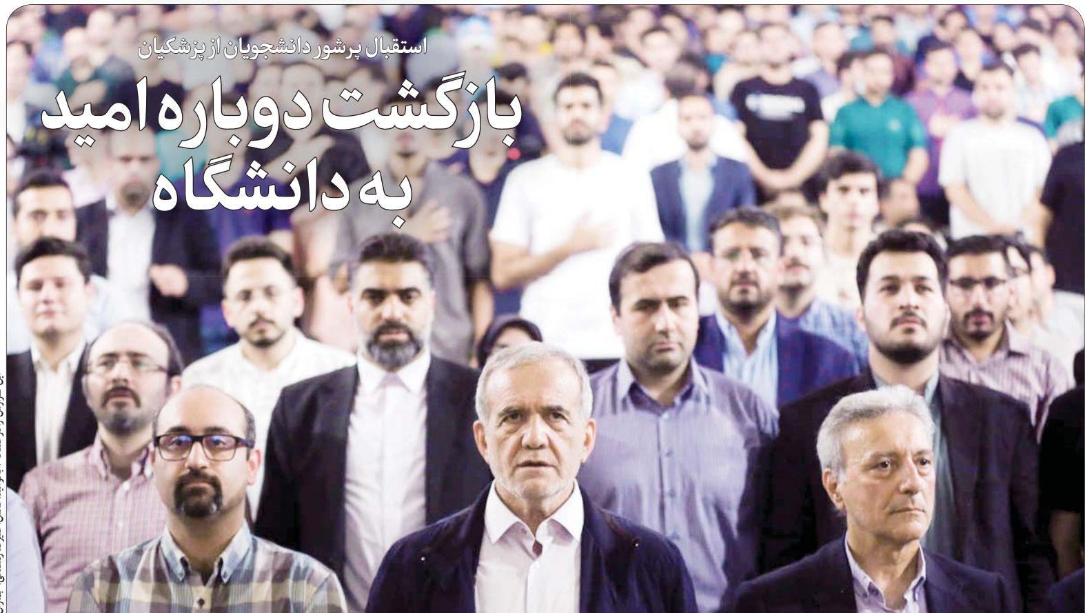
استقبال پر شور دانشجویان از پزشک‌شان