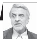
سیدمصطفی هاشمی طباطبائی

مقام معظم رهبری در سخنانی درباره وقایع اخیر خطاب به مسئولان گفتند که این وقایع شما را از کار اصلی که سازندگی کشور است، باز ندارد و نیز گفتند که درخت تومند جمهوری اسلامی غیرقابل آسیب است (نقل به مضمون). به جرئت می توان گفت که هر دو سخن بیاناتی کلیدی است و اگر مسئولان نسبت به آنچه ایشان گفته اند، نگاهی اصولی و عملی جهادی نداشته باشند، بعید نیست هر غیرممکنی صورت تحقق به خود بگیرد. آنچه ایشان گفته اند نباید زینت تابلوها و سربرگ ها شود؛ بلکه باید به آن عمل شود و حسب امکانات کشور و اولویت ها برای آن برنامه ریزی عملی صورت گیرد و در این راه به چند نکته باید توجه شود.