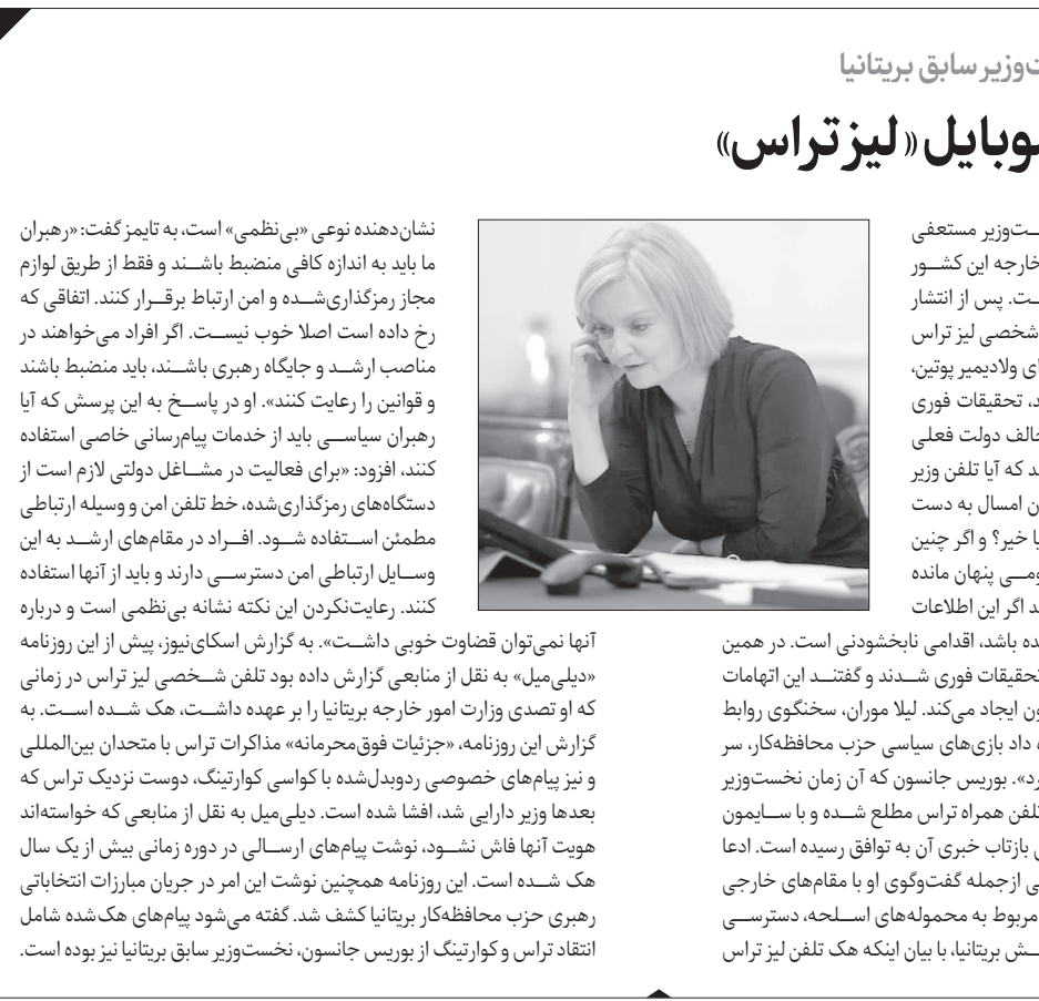
لیز تراس، نخست‌وزیر سابق بریتانیا، در زمانیکه وزیر امور خارجه این کشور بود.

۲۶ سپتامبر، کاهش شدید فشار در هر دو خط لوله گزارش شد و لرزه‌شناسان انفجارهایی را ثبت کردند. از آن پس، این بحث که چه کسی در یکی از مهم‌ترین کردیوره‌های انرژی روسیه، خرابکاری کرده است، داغ شد. روبرتز در گزارش خود در این مورد گفت که موفق نشده است هیچ‌یک از ادعاهای متعدد در این مورد را تأیید کند. سوئد و دانمارک در بررسی خود