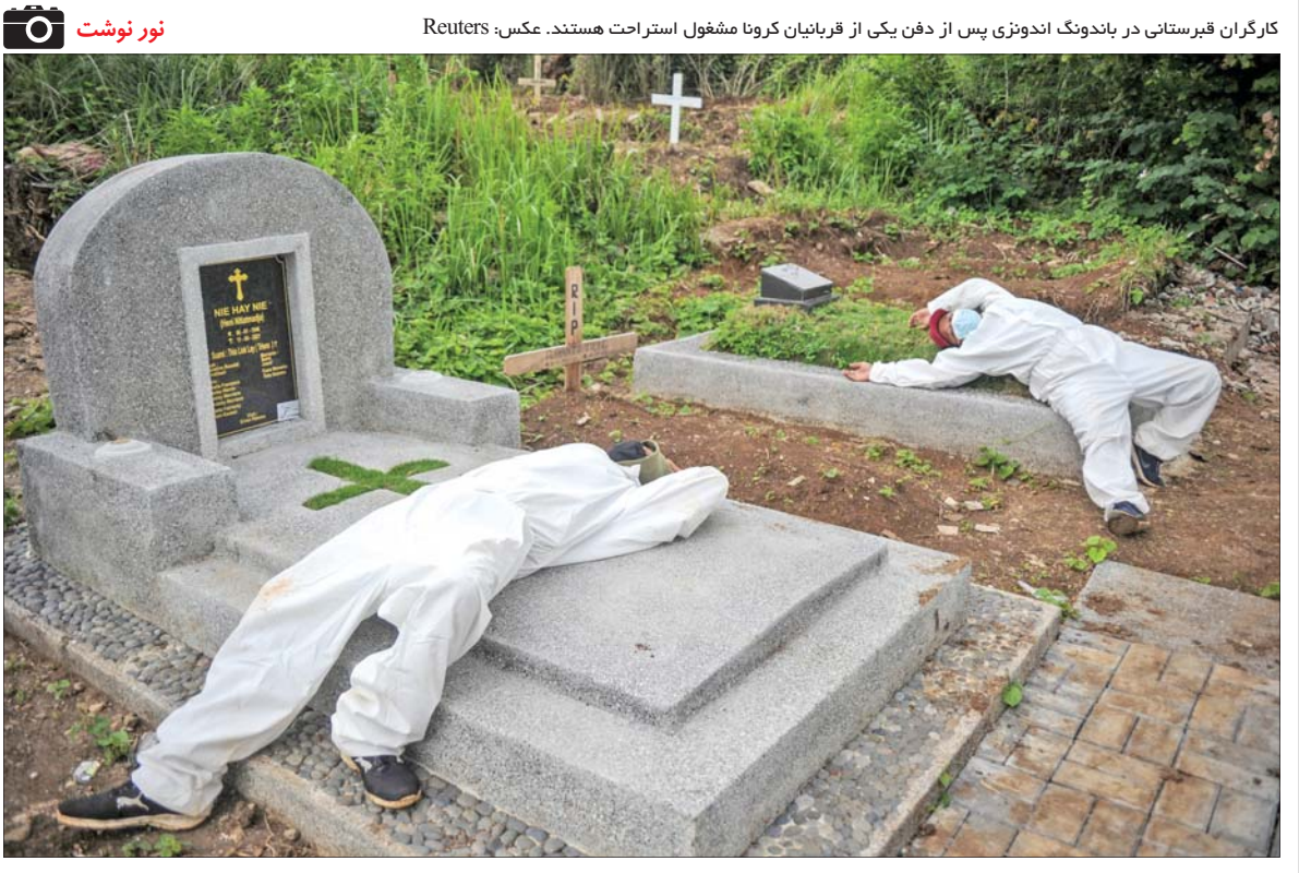
کارگران قبرستانی در باندوگ اندونزی پس از دفن یکی از قربانیان کرونا مشغول استراحت هستند.