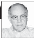
کوروش احمدی دیپلمات پیشین

بحث راجع به «دلارزدایی» یا کاهش اتکا به دلار که در پی نشست بریکس بالا گرفته، چندین سال است که در ایران و نیز در سطح بین‌المللی مطرح است. کشورهایی که تحت تحریم آمریکا هستند، به‌ویژه ایران، این بحث را با علاقه دنبال می‌کنند. بی‌شک، سوءاستفاده آمریکا از دلار یکی از دلایل تمایل شماری از کشورها به کاهش استفاده از دلار در روابط تجاری بین خود است. آمریکا در چند دهه اخیر از دلار و موقعیت مسلط خود در نهادهای مالی بین‌المللی به‌عنوان سلاحی برای اعمال فشار بر کشورهای نامرماه استفاده کرده و از این طریق بر رشد اقتصادی آنها تأثیر سوء گذاشته است. اگرچه تلاش برای کاستن از قدرت دلار بجا است؛ اما سوال این است که آیا چنین امکانی در زمان حاضر و طی سال‌ها حتی در یکی، دو دهه پیش‌رو وجود دارد یا خیر و اگر ندارد، توهم در این زمینه چه مضراتی می‌تواند داشته باشد.