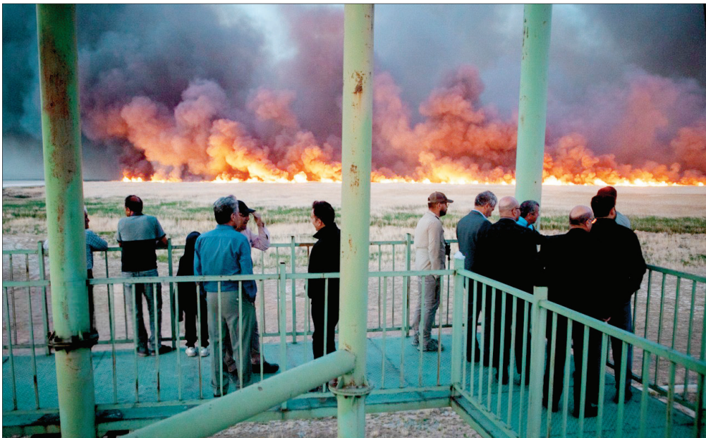
نیزارهای تالاب میقان اراک، عصر سه‌شنبه دچار آتش‌سوزی شد. شعله‌های آتش به دلیل شدت باد به سرعت گسترش یافته، با این حال تمامی امکانات و تجهیزات لازم برای مهار آتش در محل مستقر شده و عملیات اطفاي حریق بدون وقفه ادامه دارد.

پنجشنبه ۱۷ اردیبهشت ۱۴۰۵ • ۱۹ ذی‌القعده ۱۴۴۷ • ۷ می ۲۰۲۶ • سال بیست‌دوم • شماره ۵۳۷۹ • صفحه ۸۰۵ اذان ظهر تهران ۱۲:۰۱ • اذان مغرب ۱۹:۰۵ • اذان صبح فردا ۳:۲۰ • طلوع آفتاب ۵:۰۵