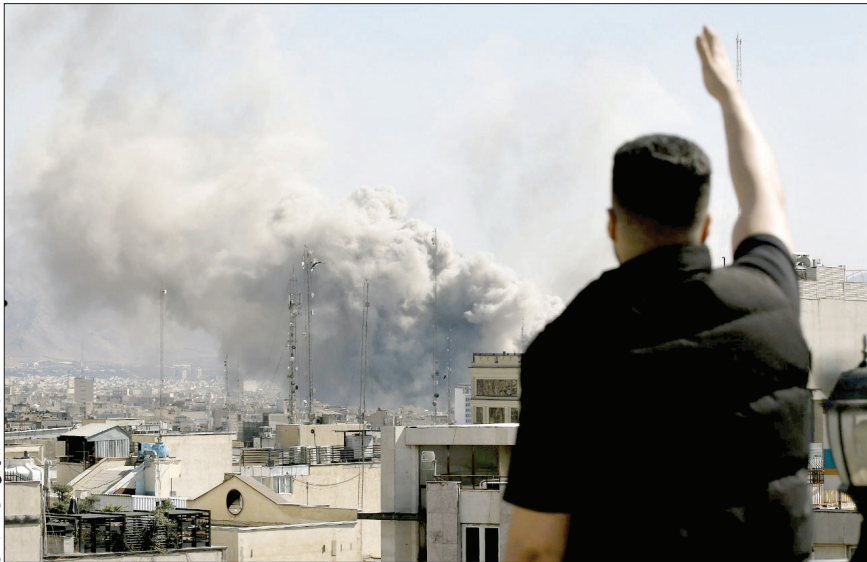
کسب‌وکارهایی در منطقه‌های گسترش‌یافته تهران

همه مراکز نظامی از شهر است، درست نیست. ممکن است برخی از این مراکز به فضاهای زیرزمینی منتقل شوند، برخی دیگر در نقاط مشخصی از شهر جانمایی شوند و همه این موارد در قالب بازنگری طرح تفصیلی و بر اساس مطالعات کارشناسی بررسی خواهد شد. در این روند هیچ اقدام شتاب‌زده‌ای وجود ندارد و همه تصمیمات بسا همراهی و مشارکت مجموعه‌های نظامی اتخاذ می‌شود.