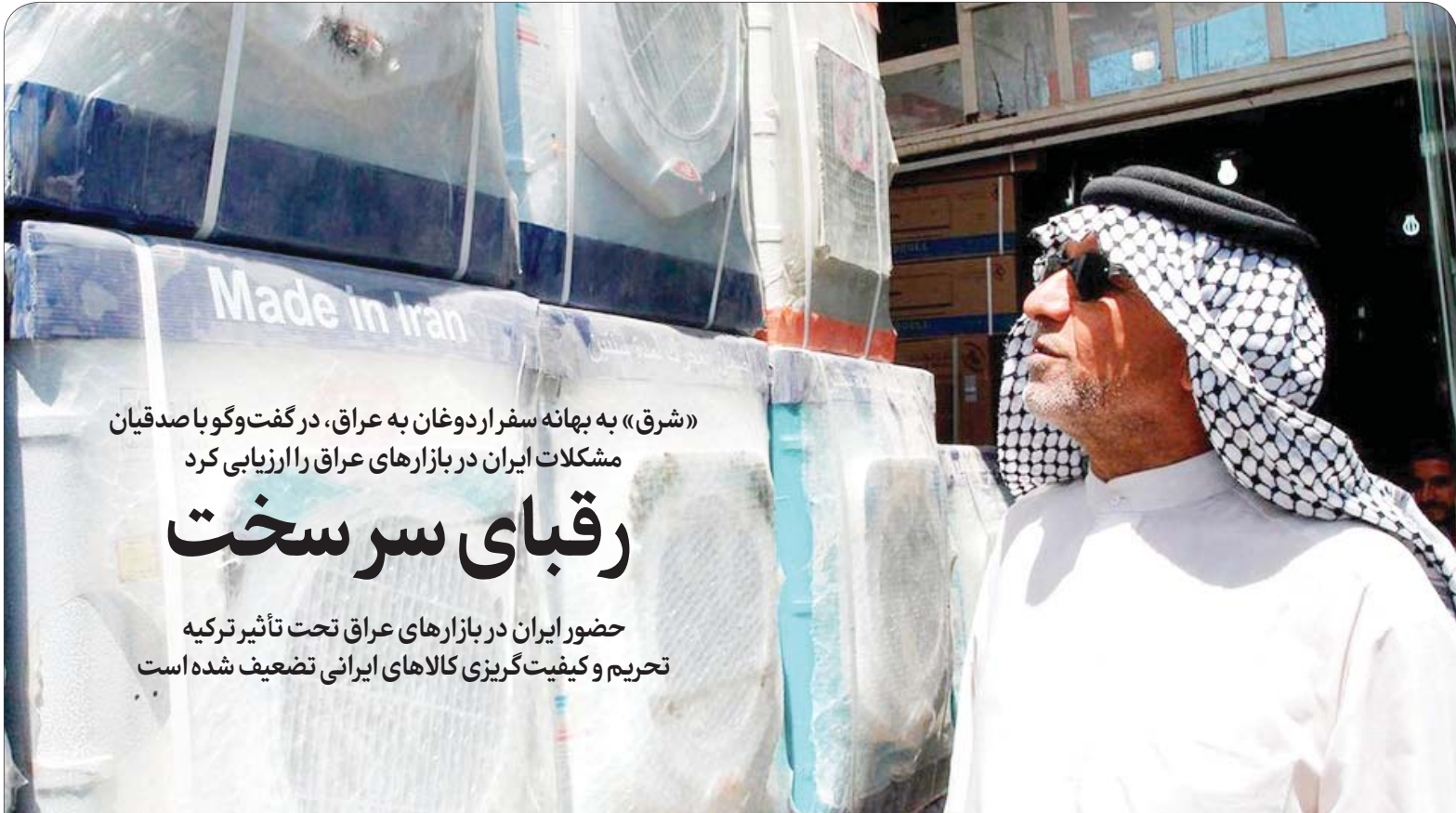
این گفت‌وگو را در صفحه ۲ بخوانید.

«شرق» به بهانه سفر اردوغان به عراق، در گفت‌وگو با صدیقان مشکلات ایران در بازارهای عراق را ارزیابی کرد