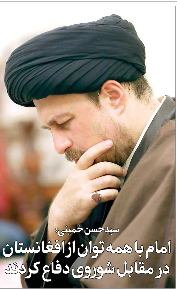
سید حسن خمینی