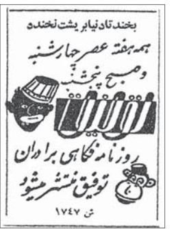
تصویر ۲- آگهی روزنامه برادران توفیق منتشر شد