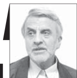
سیدمصطفی هاشمی طباطبائی

اگر حکمرانی نتواند پیام شفافیت از آینده به مردم عرضه کند، دیگر تلاش‌های او (اگرچه مثبت و مثرمتر باشد) حنای بی‌رنگ خواهد بود. پیام شفاف هم باید مطابق مشاهده مردم از زمانه باشد و هم صادقانه و به‌درستی آینده را ببیند. جهاد تبیین به معنای قالب‌کردن اندیشه و تفکری خاص به مردم نیست که نوعاً القای تفکر خاص به مردم پدیده‌های شکست‌خورده بوده و تاریخ بر این امر صحنه گذاشته است. جهاد تبیین یعنی صادقانه و به‌درستی پیام شفاف و روشن را (اگرچه تلخ باشد، به سمع و نظر مردم برساند؛ زیرا به مصداق «آنچه از دل برآید بر دل نشیند» فقط این نوع پیام را مردم جذب می‌کنند. در طول همین چند روز گذشته با اظهارنظرهای مسئولان مختلف تصویری از آینده ایران به دست مردم می‌رسد که حداقل آن ابهام در سرنوشت آینده کشور و حاکمان آن نابودی سزمین ایران است؛ زیرا وقتی مسئولان متوسل به کلام بی‌پایه شوند، تصویری مخطط و درهم از ایران آینده را مشاهده می‌کنند و طبلعه موجود هم بر آن دامن خواهد زد. کافی است نگاهی گذرا به برخی اظهارات و مطالب مندرج در دو روزنامه یفینکیم؛ مطالبی که نوعاً نقل از مسئولان کشور می‌شود.