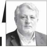
محسن هاشمی رفسنجانی

با بالا رفتن آمار آوارگی و آگاهی عمومی مردم دنیا و افزایش دانش و سلطه بشریت بر بخش اعظم اسرار این کره خاکی و فضای اطرافش، بشریت دیگر به خشونت احتیاج ندارد و سروکار مردم با عقل، تدبیر و استدلال است. مسائلمان را با جنگ و دعوا حل نمی‌کنند، بلکه می‌کوشند مسائل را با استدلال و عقلانیت حل کنند. دنیا بدون خشونت آرام خواهد شد و بشریت جایگاه خودش را پیدا می‌کند. البته یکی از شرایط آن ریشه‌کنی بی‌عدالتی است. روزهای همراه با بی‌عدالتی، آرزویی است که بشریت را منتظر راهنمای حقیقی می‌کند. ان‌شاءالله آن روز را در حیات خود ببینیم. متأسفانه در موقعیتی قرار داریم که جهان اسلام، خشن‌ترین منطقه دنیا شده است و این ضد معارف و احکام نورانی قرآن که «انما المؤمنون إخوة»، به فراموشی سپرده شده و جهان اسلام به این وضع افتاده است. از این موج‌ها هم در تاریخ اسلام زیاد داریم. ولی امروز که بشریت گام‌های بلندی به طرف تعالی برداشته، انتظار وجود ندارد که امت اسلامی چنین کشتاری را در خود ببیند. شخصاً آن‌قدرها با امام حشر و نشر یا نشت و برخواست نداشته‌ام. بنابراین نکاتی از انقلاب اسلامی و شخص امام راجل را از قول آیت‌الله هاشمی رفسنجانی مطرح می‌کنم و به آنها می‌پردازم. ایشان امام را مثال می‌زنند که به‌عنوان عارف، مجتهد، فقیه جامع‌الشرایط، خوش‌منظر و با نبوغ بالا در تاریخ ایران طلوع کرد. یکی از نعمت‌های الهی برای هدایت بشریت و لاقال یک مشعل برای دنیای اسلام و ایران را خداوند در وجود ایشان قرار داد. ادامه در صفحه ۵