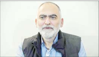
روایت حسن فحص از اوضاع لبنان