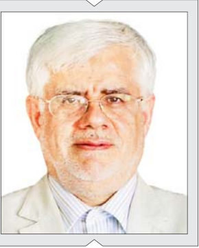
گزارش تیتربیک را در صفحه ۸ بخوانید

معاون اول رئیس جمهور: ضرورت بهره گیری از فناوری های پیشرفته راهبرد جدی دولت است