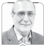
جاوید قربان اوغلی

ویژگی این جمع حضور همکاری بود که فارغ از خط و ربط سیاسی که از لوازم غیرقابل انکار «دیپلمات بودن در نظام جمهوری اسلامی است و در اساسنامه این وزارت هم بر آن تأکید شده، برای هدفی ملی گرد هم جمع شده بودند. در نهایت آزادی به بیان نقطه نظرات خود پرداختند و مهم ترین سخنگوی جوان وزارت امور خارجه با صبوری و بردباری به نظرات جمعی ریش سفید گوش داد، یادداشت برداری کرد و قول استمرار آن را داد؛ اقدامی به غایت شایسته و قابل تقدیر. در همین جا فرصت را مقتضی کرده و از همکاری شرکت کننده در این جلسه درخواست دارم نظرات مطرح شده خود را از طریق نشر در رسانه ها در اختیار افکار عمومی قرار دهند. تردید ندارم که مرکز دیپلماسی عمومی و رسانه ای وزارت امور خارجه از این امر استقبال و آن را در جهت پیشبرد اهداف مرکز تلقی خواهد کرد.