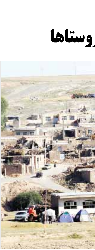
عکس از زمین لرزه در ورزقان

من گزارشی ندیده‌ام. مساله مقاوم‌سازی مدارس و بیمارستان‌ها خیلی مهم است چون جمعیت آنها متراکم و بسیار آسیب‌پذیرند.