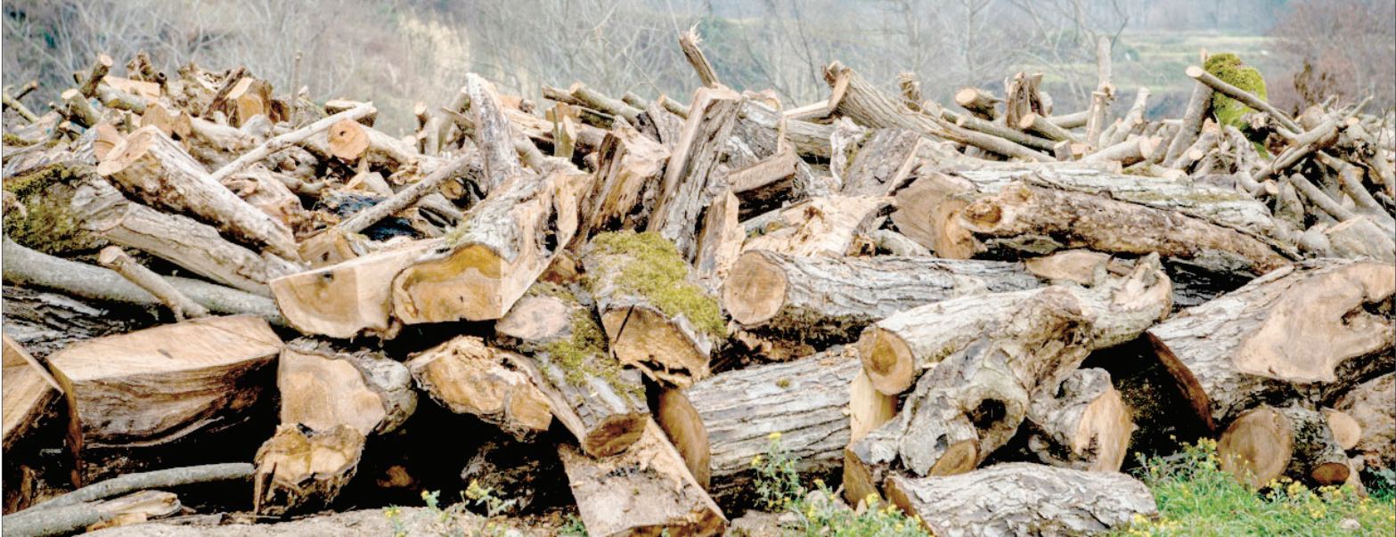
این گزارش رادر صفحه ۵ بخوانید