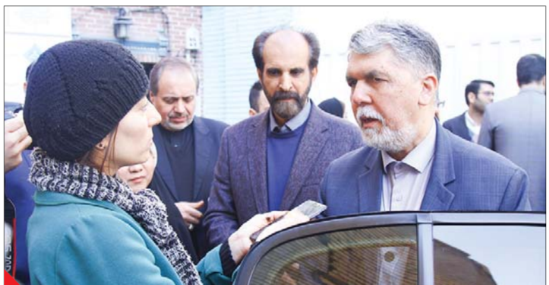
نخستین بازدید عالی‌جنابین مقام وزارت از نمایان فعالیت کارگروه مد و لباس کشور از سال ۱۳۹۸ تاکنون.