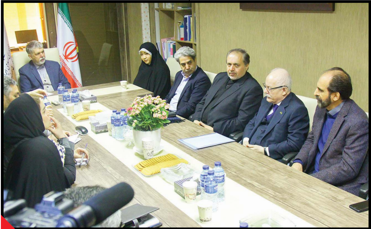
نخستین بازدید عالی‌جنابین مقام وزارت از نمایان فعالیت کارگروه مد و لباس کشور از سال ۱۳۹۸ تاکنون.

پس مثل مسرری قبل نخواهد بود. در دوره قبل بانوان می‌توانستند شوهایی آقایان را تماشا کنند اما آقایان خیر. این طرح تفکیک‌پذیر به‌دلیل فشارها و تنش‌هایی است که از حواشی قبلی به جا مانده است؟ مجبوزی را که درباره آن صحبت می‌فرمایید، مشخصاً کدام نهادها قرار است صادر کنند؟ ما هنوز نمی‌دانیم در بحث صدور مجبوز مجدد ازسرسگیری