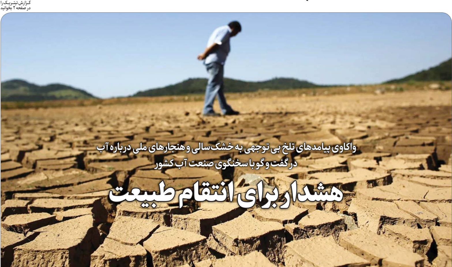
این گزارش را در صفحات ۴ و ۵ بخوانید.

واکاوی پیامدهای تلخ بی توجهی به خشک‌سالی و هنجارهای ملی درباره آب در گفت و گو با سخنگوی صنعت آب کشور