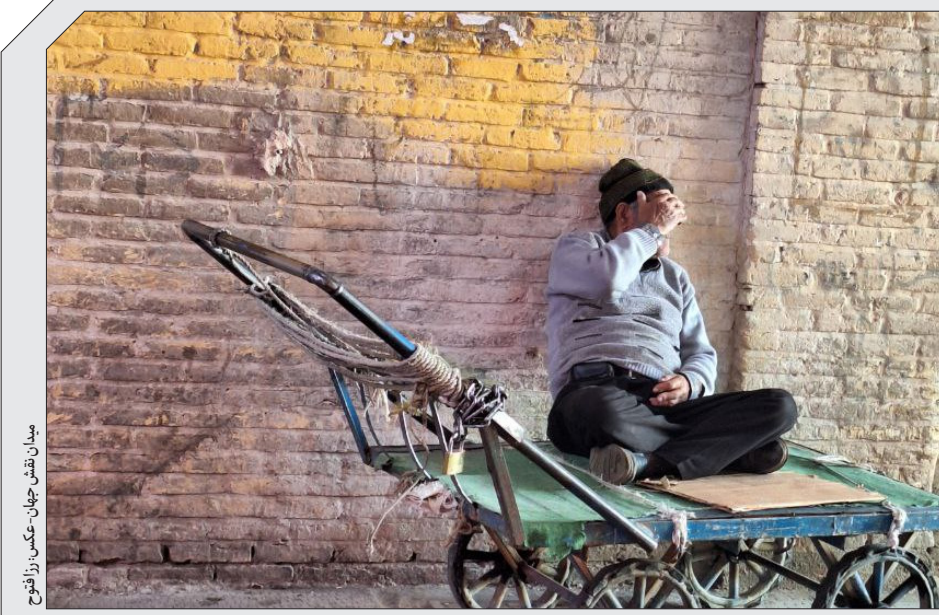
میدان نقش جهان، اصفهان، زرافتح

زندگی مثل چرخ است قرار نیست کسی دوباره اختراع اش کند یکی بگوید چرا نمی چرخد