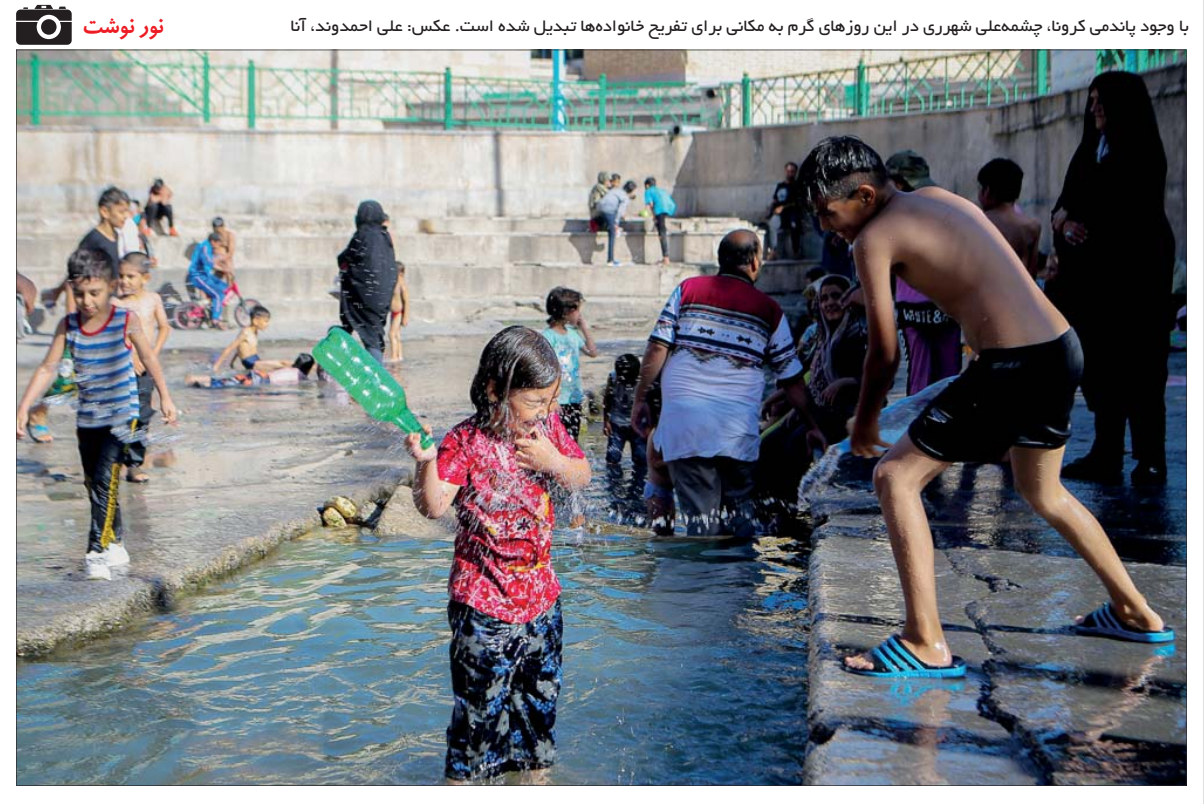
با وجود یاندمی کرونا، چشم‌عملی شهری در این روزهای گرم به مکانی برای تفریح خانواده‌ها تبدیل شده است.