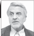
سیدمصطفی هاشمی طباطبائی

یکی بود یکی نبود. در روزگارهای نه چندان دور جمعاعتی بودند که برای خود فکلهایی دست و پا می‌کردند و با وجود تعداد کم، صدایشان از تبلیغات رسایی برخوردار بود و تابلوهایشان به ظاهر جهان‌شومول. می‌گفتند ما همه‌جا را فتح می‌کنیم و جسوران آنها می‌خواستند کاخ الیزه را حسینیه و کاخ سفید را مسجد کنند اما به کاخ کرملین کاری نداشتند و به رئیس آن موقع ایراد می‌گرفتند که شما منحرف شده‌اید که گفت‌وگوی تمدن‌ها را فریبانه علم کرده‌اید و ما تابع نظریه فوکودای ژاپنی اما از سوی خود هستیم. می‌گفتند برای چه عضو سازمان ملل هستیم و چرا اصول حقوق بشر را پذیرفته‌ایم. خودمان حقوق بشر خیلی بهتر داریم و البته «بشر» را به معنای «خودمان» به کار می‌بردند. سفارت انگلیس و عربستان را آماج حملات خود قرار داده بودند. چراکه یکی رویاه پیر بود و دیگری قاتل به مهدورالدم‌بودن شیعیان و به همین روبه رئیس وقت معترض بودند که نوکر شاه فهد شده است. البته این زمانی بود که عربستان و امارات و بحرین و برخی دیگر دولت‌ها را قابل براندازی می‌دانستند. درحالی‌که آن موقع جای پای اسرائیل در آنها دیده نمی‌شد. پاسی از روزگار گذشت و حاکمان تغییر کردند. آنان که مشت‌های آسمان‌کوب قوی داشتند به قدرت رسیدند و ساده‌لان چنین تصور می‌کردند که اینک نوبت تحقق آیه شریفه «نفی سبیل» است، ولی دیری نگذشت که دیدند باید کشتی‌بان سیاستی دیگر پیشه کند و چنین شد که راه جدیدی برگزیدند که صد البته نشان از واقع‌بینی در برابر مسائل داشت. این بار با وجود اینکه امارات و بحرین پایگاه اسرائیل شده بود روابط عربستان با اشغالگران قدس برملا، عاقلانه نرد دوستی ریختند و سفارت سوخته عربستان را احیا کردند و در عین سفر به آن کشور حاکم غاصب خوانده آنجا را گرامی داشتند.