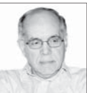
کوروش احمدی دیپلمات پیشین

۲۴ اسفند مصادف با هفتادومین سالگرد تصویب قانون ملی‌کردن صنعت نفت در مجلس شورای ملی است. این قانون با توجه به تحولات سیاسی و به‌ویژه کودتای ۲۸ مرداد که در پی داشت، یکی از اثرگذارترین تحولات در ایران معاصر است. اما به دلیل سیاست دولت‌های مستقر در ۶۹ سال گذشته و نیز تلاش برخی جریان‌ها برای استفاده از تاریخ جهت توجیه سیاست‌های روز، نسل جدید شناخت چندان از این تحول و دیگر تحولات ایران بعد از مشروطه ندارد. این در حالی است که دریافت شناختی عینی و درست از گذشته پیش شرط قرار گرفتن در مسیری درست در حال و آینده است. رد توافق قوام‌السلطنه درباره اعطای امتیاز نفت شمال به شوروی در مجلس یازدهم نقطه شروع روندی شد که به ملی‌کردن صنعت نفت انجامید. مجلس در ۹، ۲۶، ۱۳۲۶ علاوه بر رد توافق مذکور، دولت را مکلف به استیفای حقوق ملت ایران در سایر موارد، «به‌خصوص راجع به نفت جنوب» کرد. این قانون در حالی تصویب شد که کمیته نفت انگلیس و ایران که بر اساس قرارداد ۱۳۱۲ عمل می‌کرد، در محافل سیاسی و رسانه‌ای ایران به‌شدت مورد انتقاد بود، مصدق که بعداً در مجلس شانزدهم نقشی محوری در ملی‌کردن نفت ایفا کرد، عضو مجلس یازدهم نبود و دخالتی در تصویب این قانون نداشت. اهم تحولاتی که ملی‌کردن صنعت نفت را اجتناب‌ناپذیر کرد، به شرح زیر قابل تلخیص است: